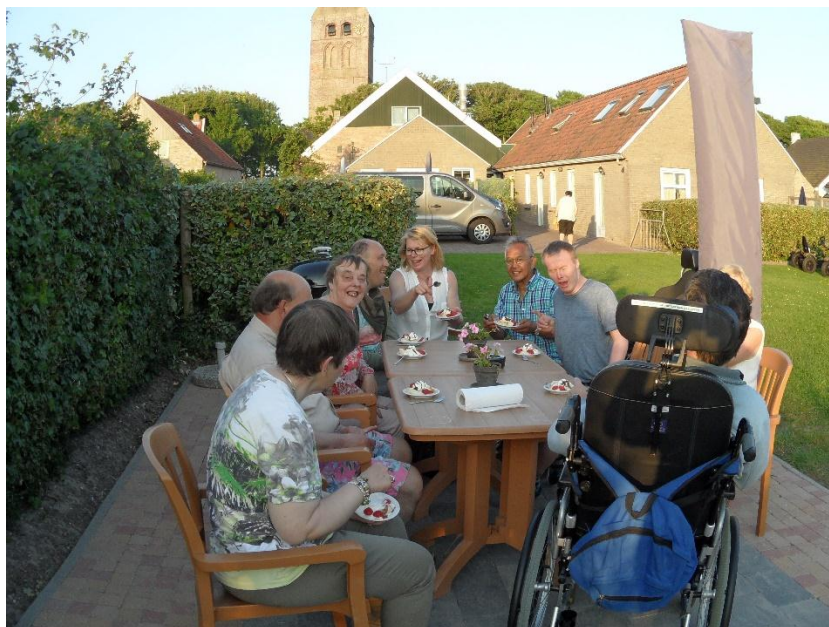
Toetje na met ijs en slagroom, wat een feest.....!