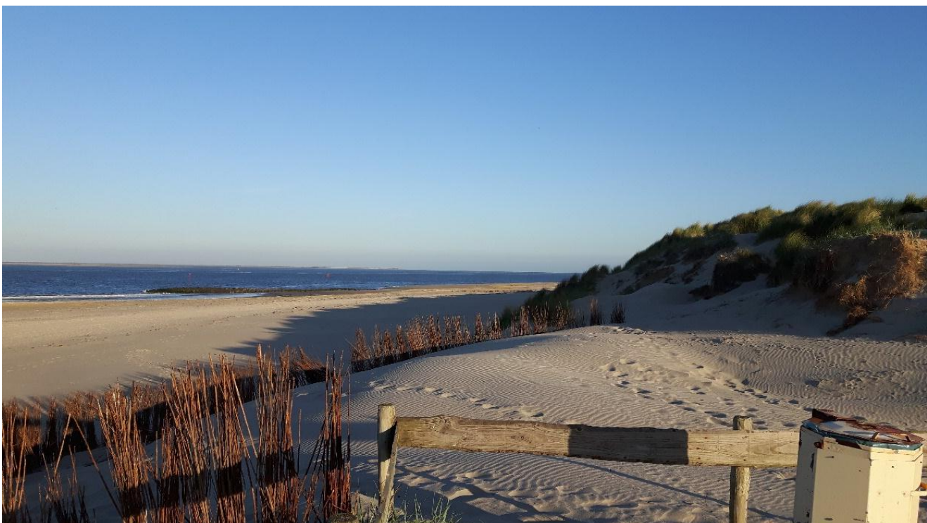
Uitzicht op de Waddenzee

Een beetje moe van alle indrukken van de nieuwe omgeving zijn wij op tijd naar bed gegaan, vol verwachting naar de komende vakantiedagen op Ameland.