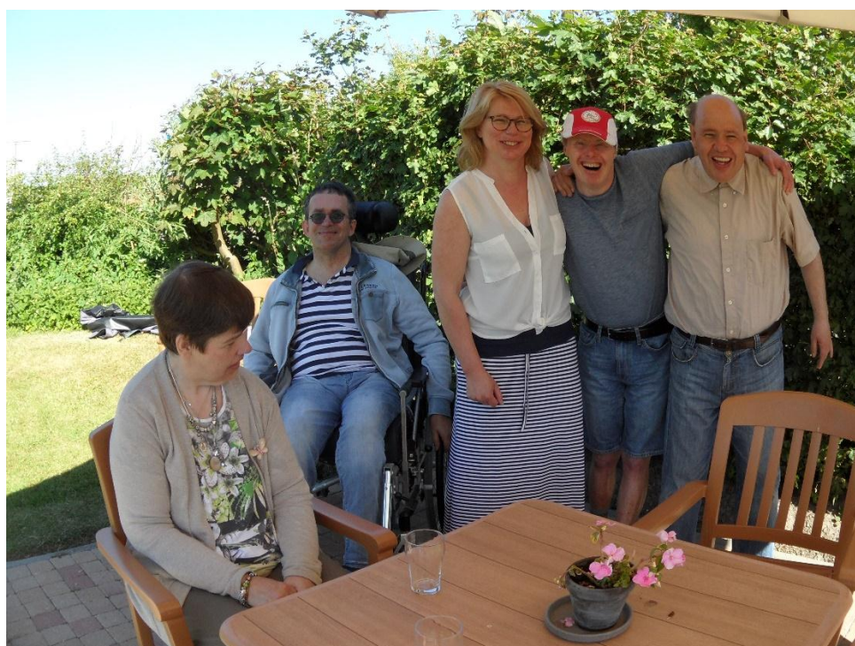
Na zo'n huifkartocht is het heerlijk even bij te komen op het terras