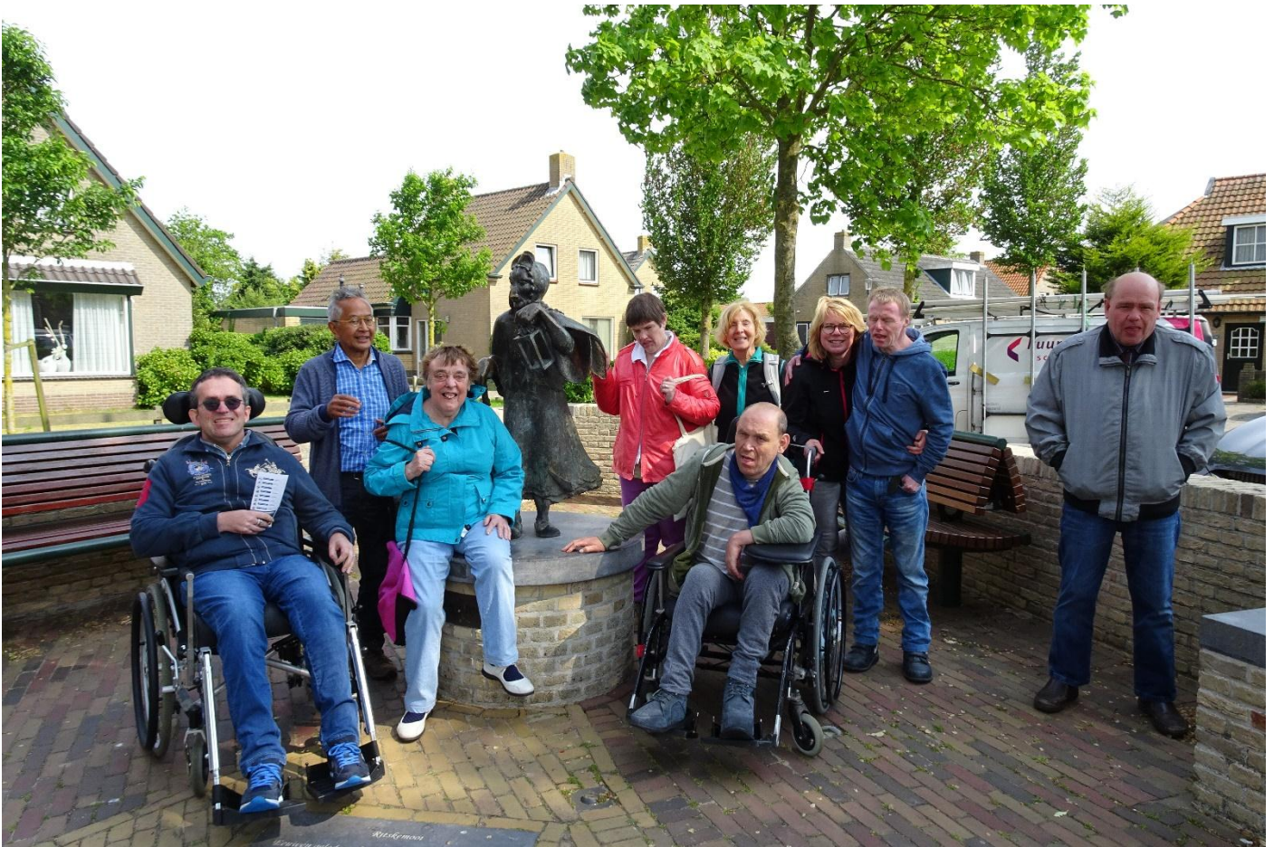
Allemaal rondom het standbeeld van Rixt van Oerd oftewel De Heks van Oerd, De beroemdste sage van het plaatsje Buren

Na de lunch besloten wij naar het plaatsje Buren te gaan, gewoon om ook daar de omgeving te verkennen. Ook zo'n knus klein toeristendorpje, gezellig allemaal. Leuke wandeling door het dorp gemaakt.