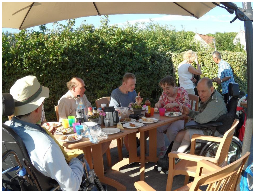
Wat is barbequen toch gezellig maar vooral heerlijk smullen

s Avonds BBQ. In de tuin op het terras onder de 2 grote parasols. De BBQ-apparatuur mochten wij van de eigenaar van De Sudwester gebruiken, zeer handzaam, handig en mooi groot. Begeleidster Hannie had keurig voor alle soorten BBQ-lekkers gezorgd en wij hebben gesmuld van alle soorten vlees, fruit en groenten, stokbrood met smeerkaasjes etc etc. Een goed en smakelijk begin van de vakantie.