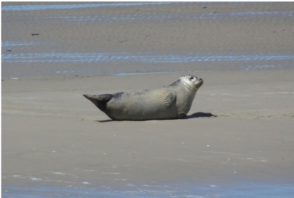
Eentje moet toch de wacht houden