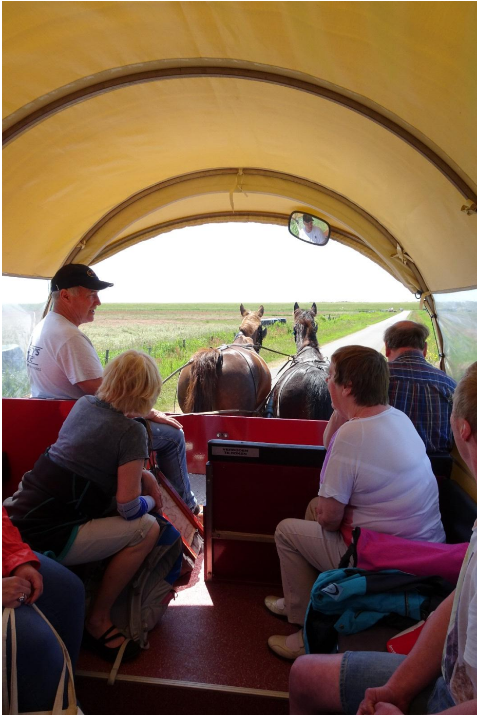
Hop paardjes hop, paardjes in galop....