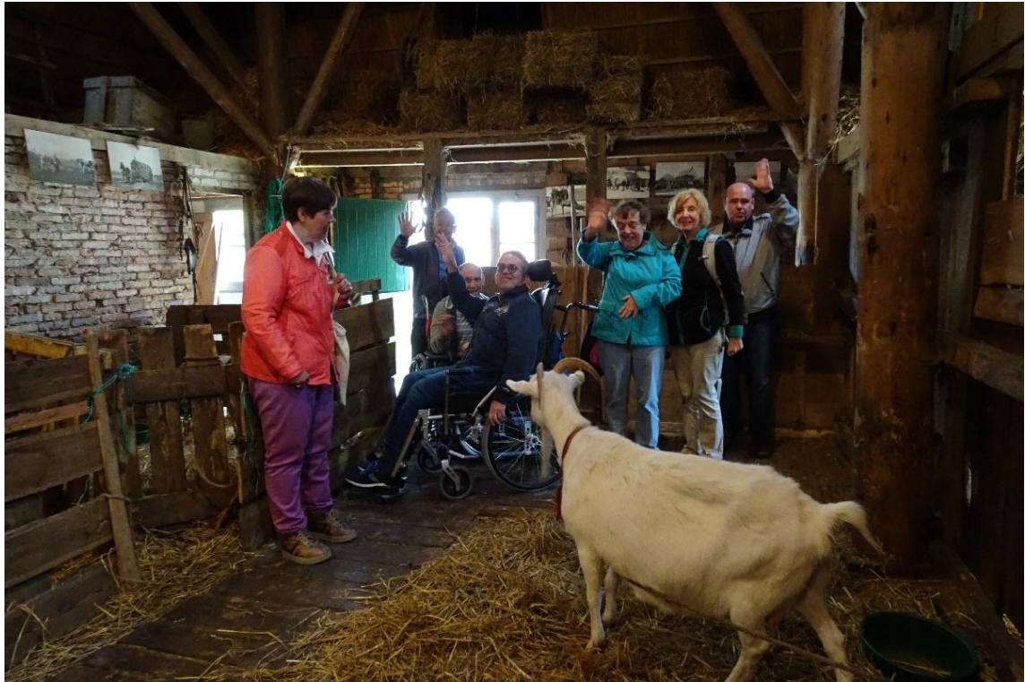
In de stal uit vroegere tijden ontmoeten wij nog enkele geiten