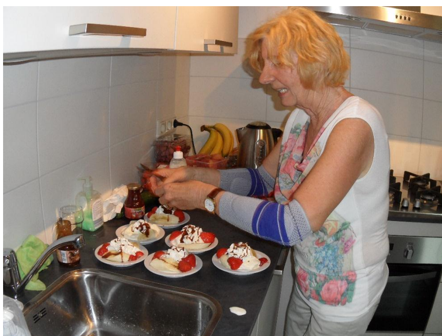
Dat ziet er echt lekker uit.....