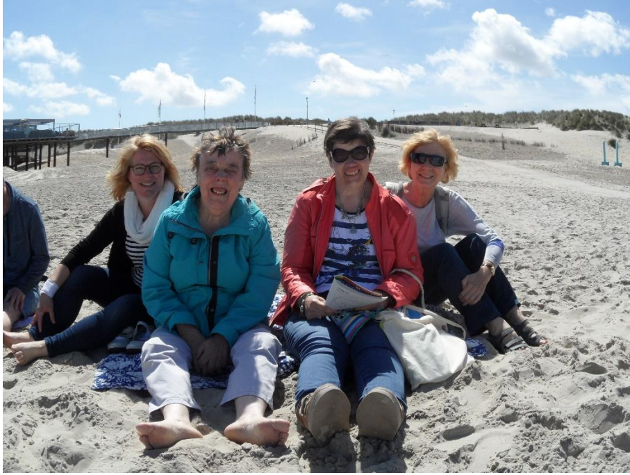
De 4 dames aan het genieten