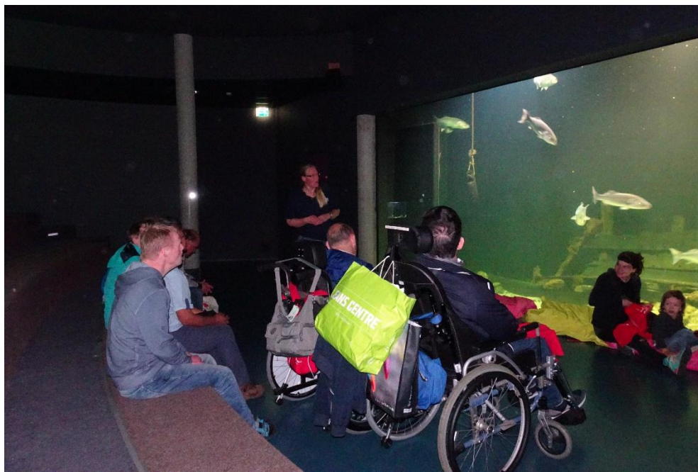
Tekst en uitleg door de gids bij het grote zee-aquarium