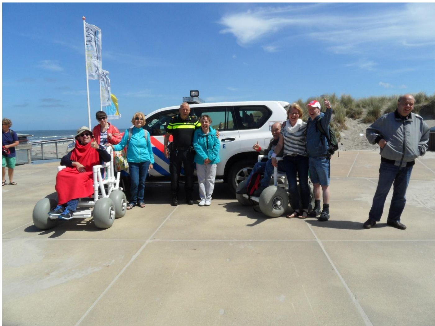
De politie is onze beste vriend en wilde best met ons op de foto, lekker stoer !