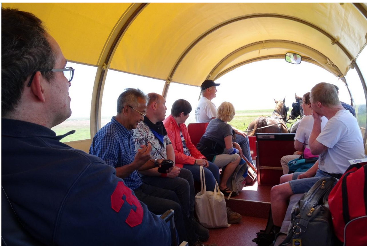
Gezellig zo met z'n allen in de huifkar, genieten van het mooie Ameland