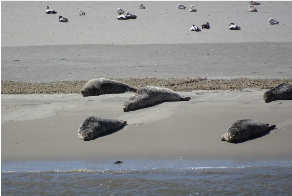
Familie zeehond : Lekker van de zon genieten